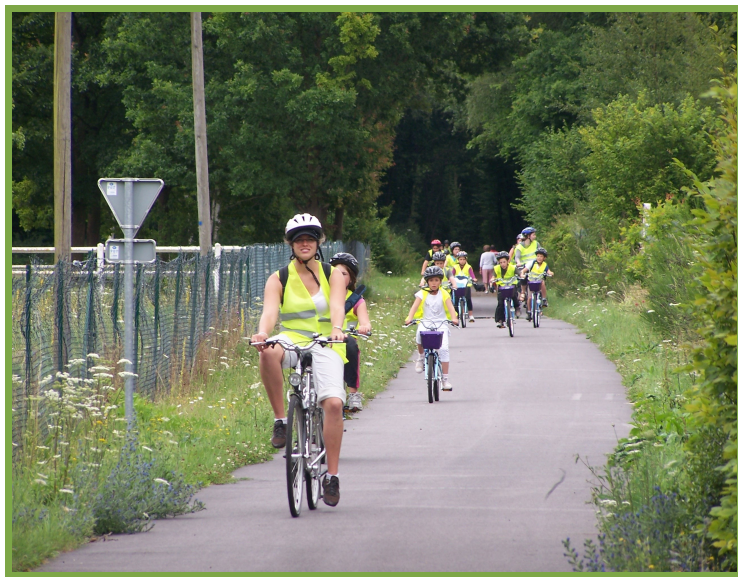
Voie verte Pont Authou - Evreux